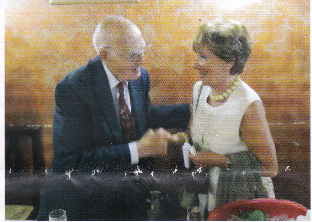
Generale Angelo Fisicaro e signora Rita Stornelli