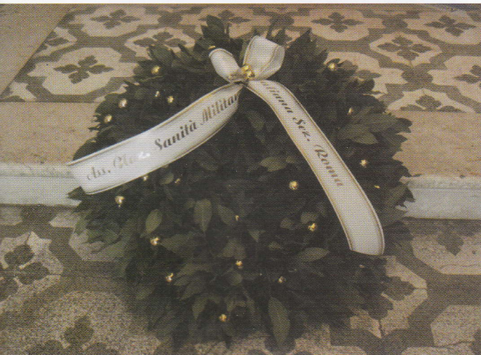
La corona d'alloro della Sezione ANSMI di Roma presso l'ossario di Solferino