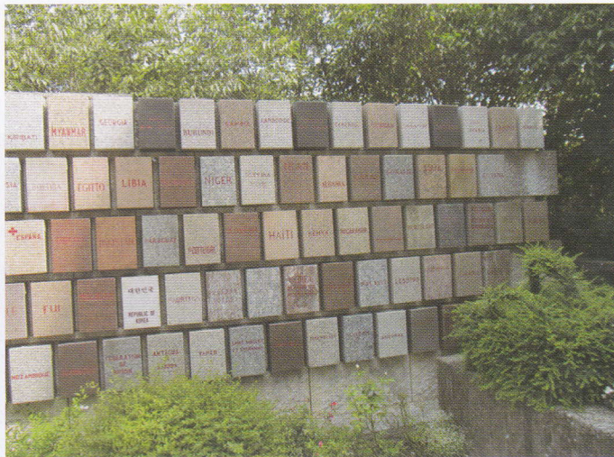
Varie ceramiche con le scritte di tutti gli Stati aderenti alla Convenzione di Ginevra della Croce Rossa

stati aderenti. Successivamente abbiamo visitato la Rocca e la chiesa parrocchiale.