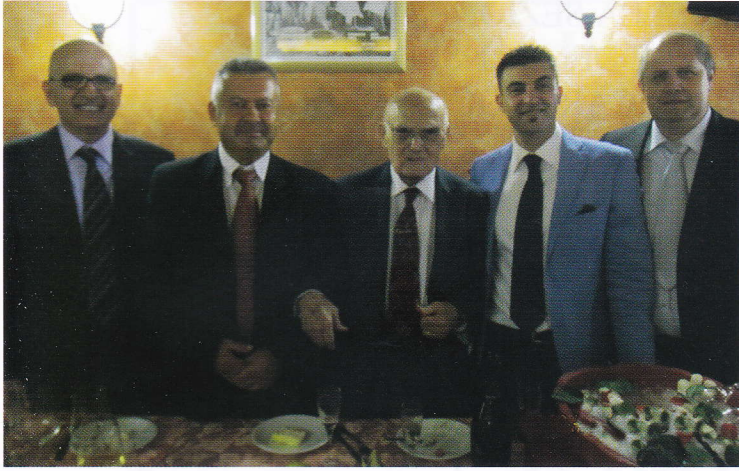
Gruppo Carabinieri di Villa Fonseca

medaglia di Roma Capitale. Unico rammarico, da parte mia e di tutti i soci della Sezione di Roma, è stato la totale assenza dei Vertici della Sanità Militare Esercito in attività di servizio, che non hanno saputo cogliere l'occasione, unica, di presenziare ad una così importante cerimonia di un loro collega medico in occasione del Suo centesimo genetliaco. In altre As-